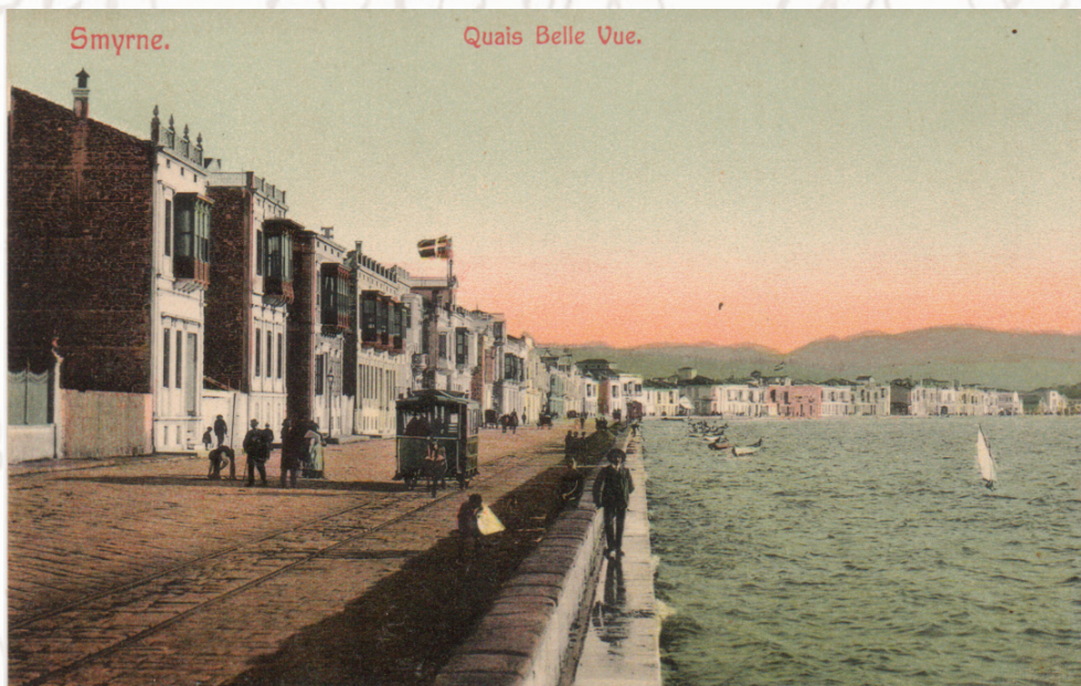
Καρτ-ποστάλ. Η προκουμαία της Σμύρνης.